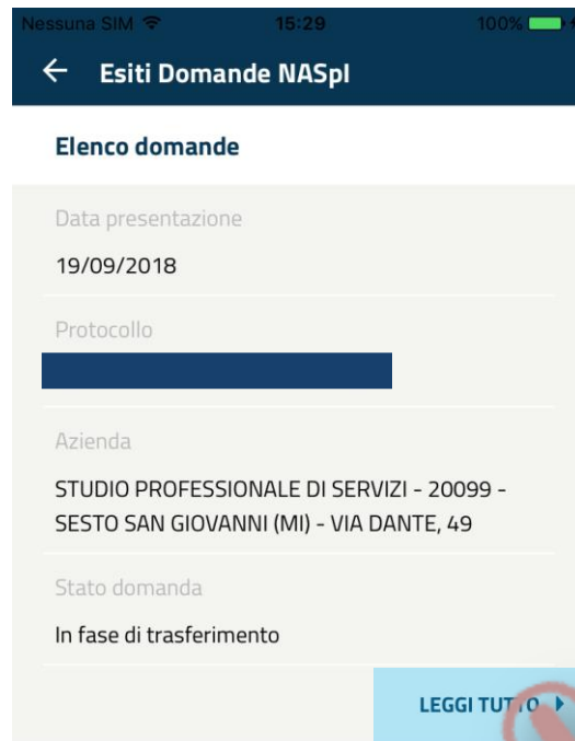
Schermata elenco domande